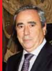
Enrique Cascallana Gallastegui Alcalde de Alcorcón